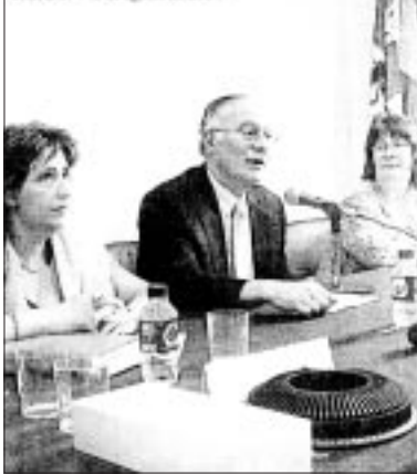
El rector de la Usek presidió el cierre de las sesiones

EL ADELANTADO DE SEGOVIA SÁBADO • 1 de agosto de 2004