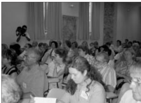
Sesión de trabajo.