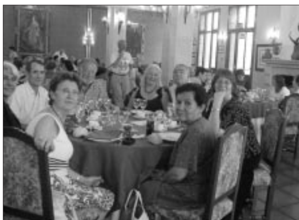
Banquete de Clausura en el Pórtico Real.