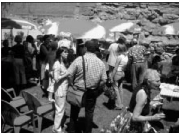
Visita a Salamanca. Centro Don Quijote.