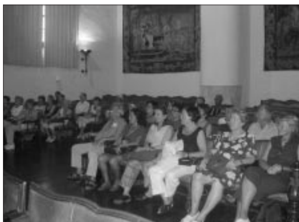
Sesión en la Universidad de Salamanca.