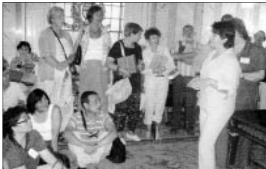
Visita de los docentes al Ayuntamiento de Segovia