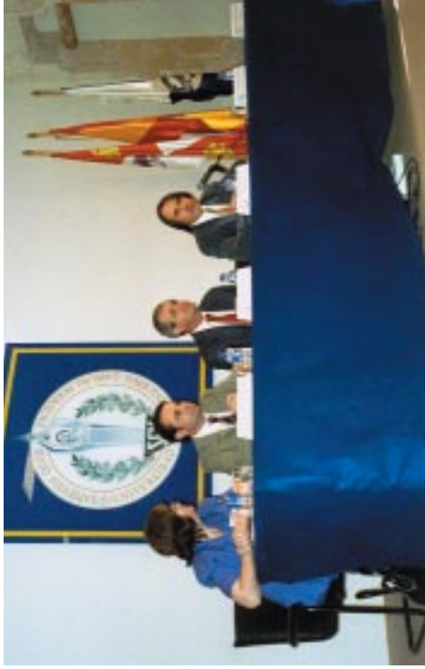
Solemne Inauguración presidida por el Consejero de Educación de la junta de Castilla y León y por el Alcalde de Segovia. Artista: Léontine Freere de Vrijer.