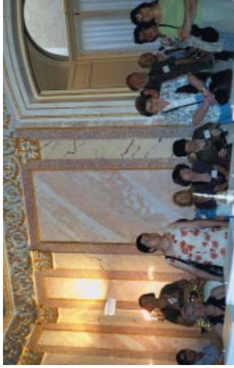
Grupo de profesores participantes en el Congreso de Segovia. Artista: Léontine Freere de Vrijer.