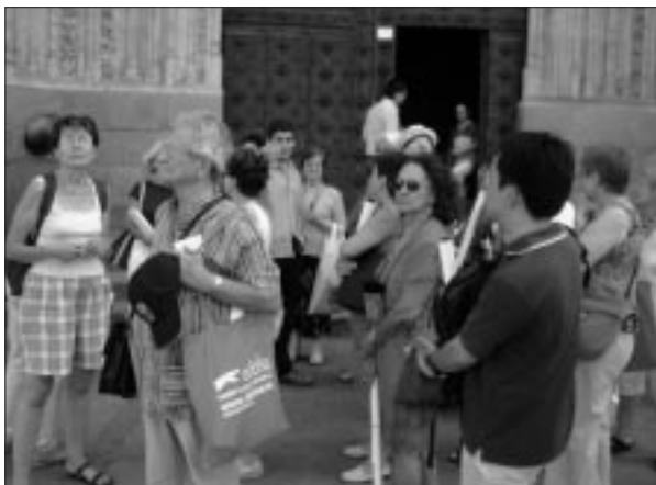
Visita a Salamanca. Universidad.