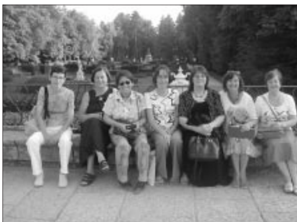
Visita a la Granja.