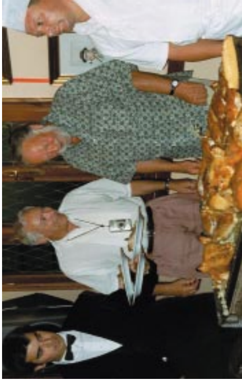
Dos conocidos aepéistas, voluntarios para cortar el cochinitillo al estilo segoviano. Artista: Léontine Freere de Vrijer.