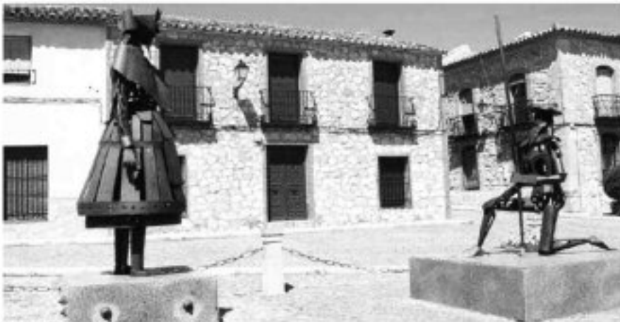
LA GRANDE ARTE DI DON CHISCIOTTE E LA FIDELITÀ DEL FORO. INDIAGIATO DA UNO DEI