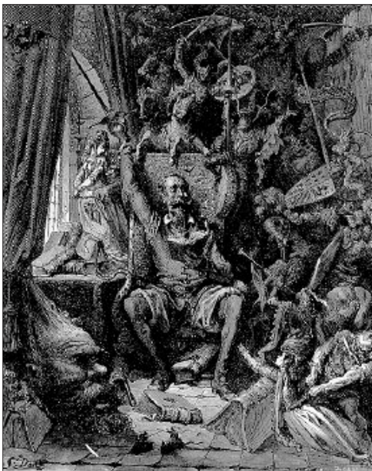
Don Quijote, Doré